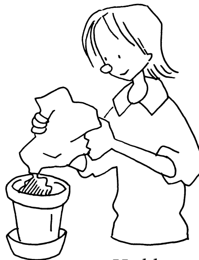
Hæld potte-muld i urte-potten