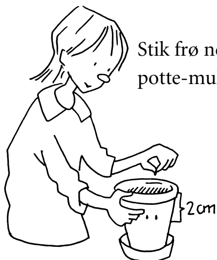
Stik frø ned i potte-mulden.